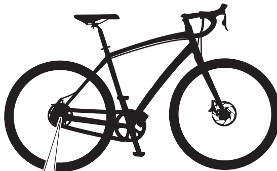
Unidades de motor