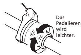
Das Pedalieren wird schwerer.